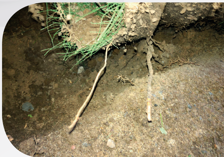
Système installé en 2003, inspecté en 2020