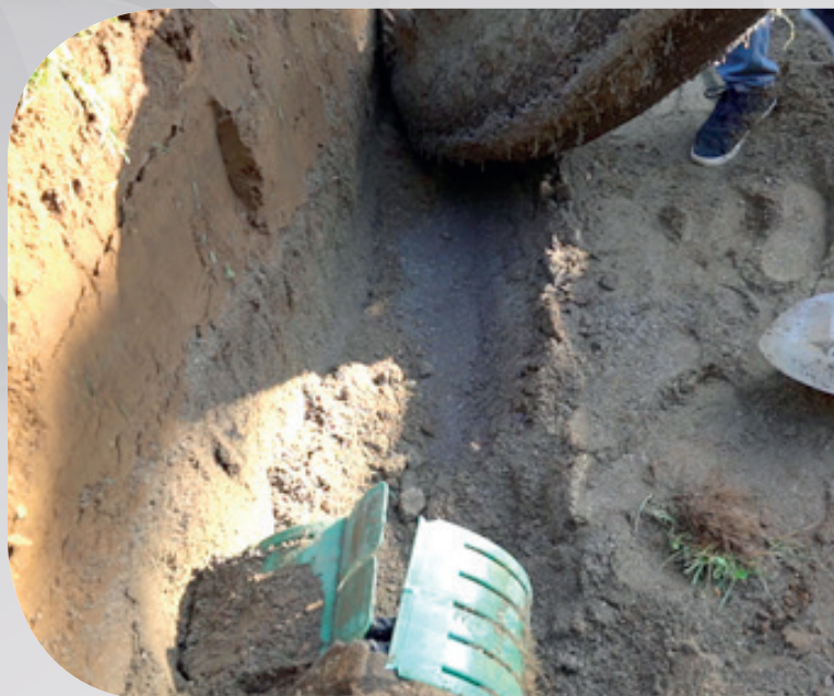
Système installé en 2004, inspecté en 2019

Des inspections détaillées de systèmes avec plus de 15 ans d'utilisation confirment d'ailleurs ces explications: